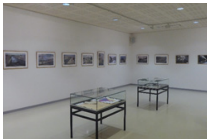
Sint-Niklaas STEM: Piet Elshoutzaal 8 januari-6 februari 2022