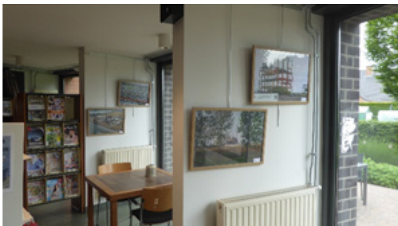
Sint-Gillis-Waas: De Route en Bibliotheek 10 mei-30 juni 2022