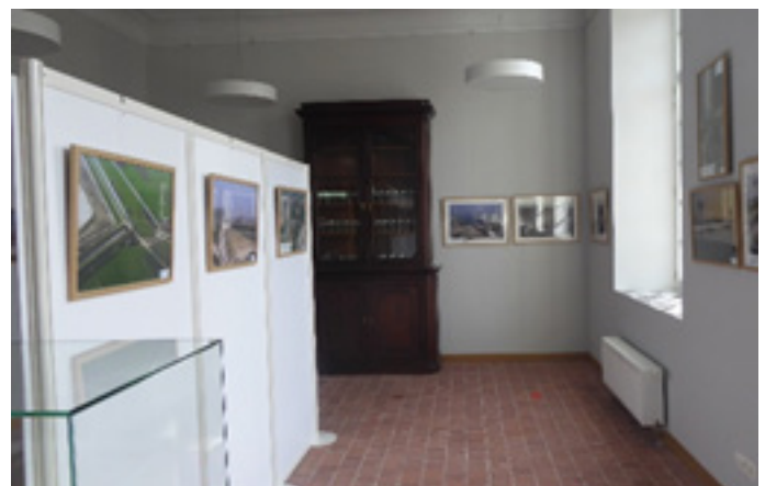
Beveren: Hof ter Welle 13 februari-27 maart 2022