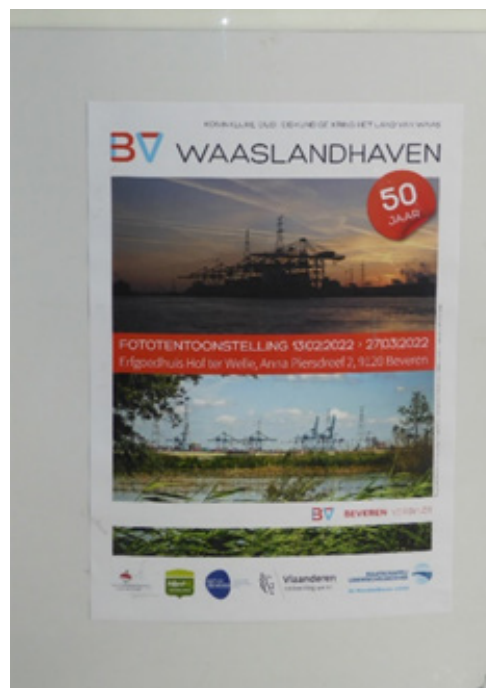
Volgend jaar 2023 maart / april in Kruibeke