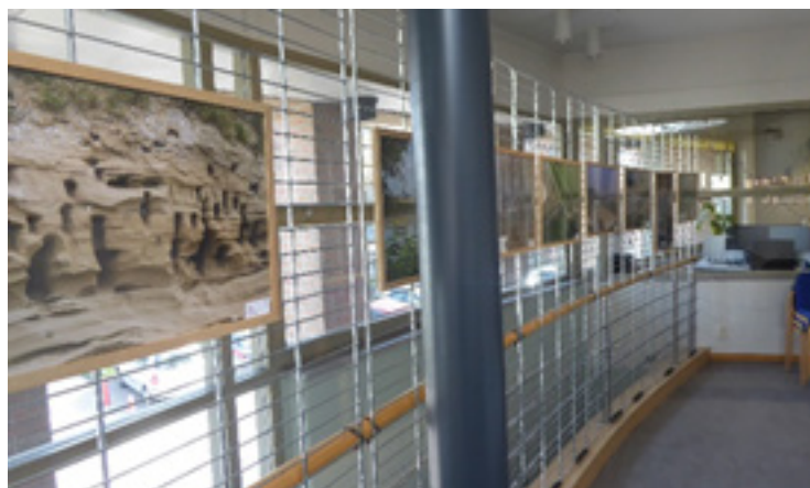
Zwijndrecht-Burcht: 't Waaigat 2 april-2 mei 2022