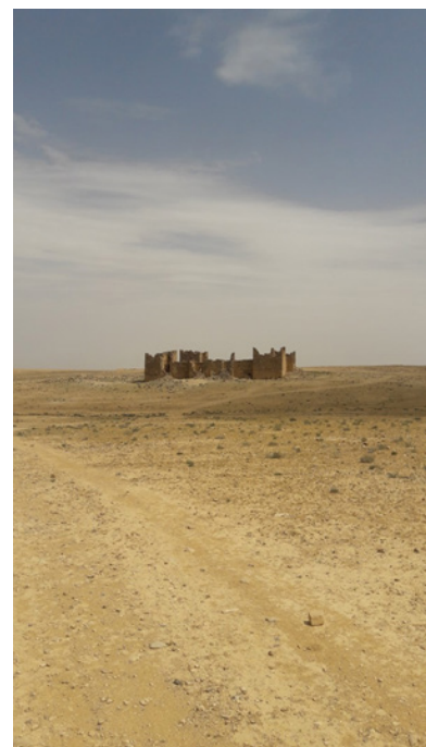
Castellum Qasr Bshr, een woestijnfort in Jordanië uit de tijd van Diocletianus (ca. 300)