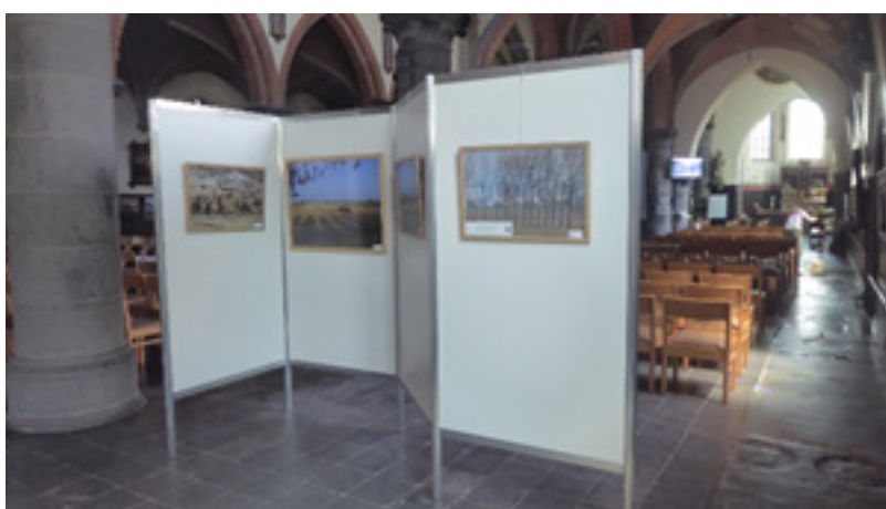
Stekene: H. Kruiskerk 7 juli-15 augustus 2022